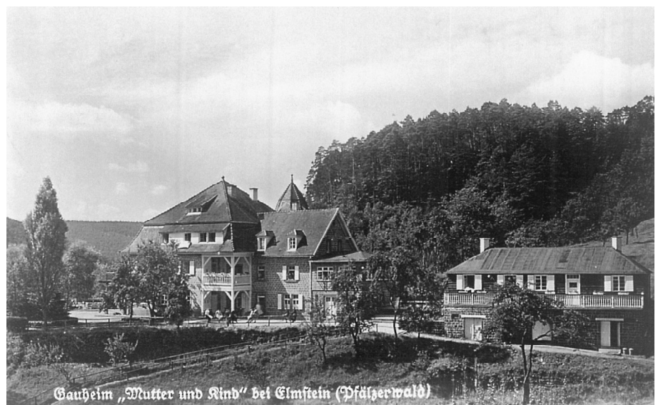
Gauheim „Mutter und Kind“ bei Elmstein (Pfälzerwald)