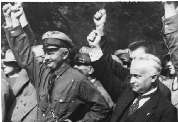
Friedrich Wilhelm Wagner (rechts) *1894 †1971, Carl Wilhelm Severing *1875 †1952

Das völlige Versagen des jeweiligen Parteiselbstschutzes illustriert das Beispiel des Ludwigshafener SPD-Reichstagsabgeordneten und pfälzischen Reichsbannerführers Friedrich Wilhelm Wagner.