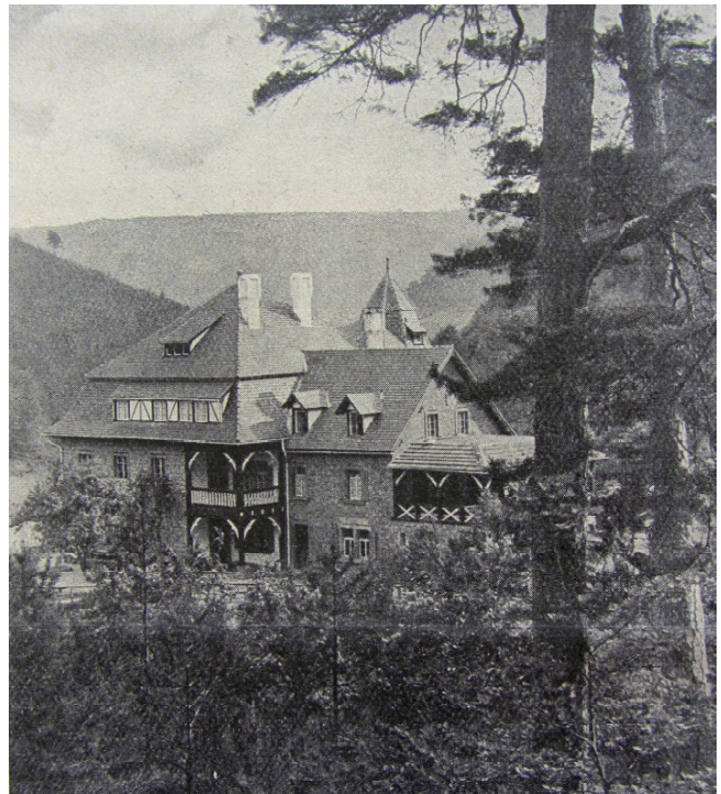
Andere Ansicht des Ferienheims auf dem Harzofen (StALU)

Schon wenige Monate später war das Haus überfüllt, als es über 100 Oppauer Kindern sechs Wochen Obdach bot, die nach der verheerenden Explosion im Werk Oppau der BASF heimatlos geworden waren. (Siehe Bild nächste Seite)