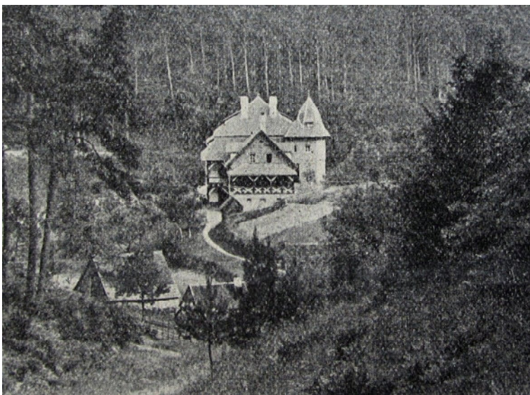
Das Arbeiter-Ferienheim des Touristen-Vereins „Die Naturfreunde“ von der Quelle aus gesehen (StALU)

Bei der offiziellen Einweihung des Elmsteiner Hauses am 15. Mai 1921 freuten sich die Genossinnen und Genossen darüber, dass man nicht nur das erste Naturfreundehaus in der Pfalz, sondern zugleich auch das größte Naturfreundehaus in Deutschland errichtet hatte.