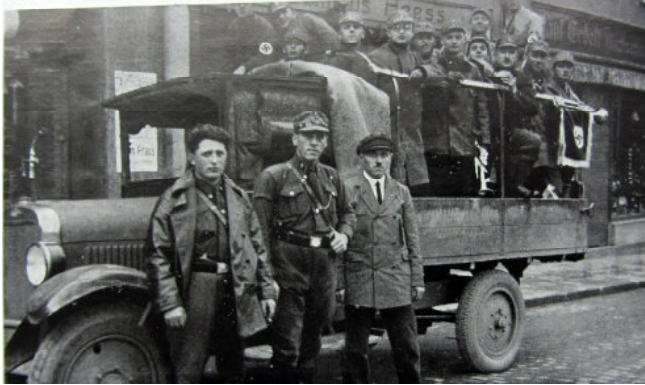
SA-Ausfahrt 1927

nachfolgende Verschuldung getrieben. Betten, Möbel und Inventar wurden geplündert und selbst die Vereinsbibliothek wurde verschleppt. Mit dem Verbot des Allgemeinen Deutschen Gewerkschaftsbundes am 02. Mai 1933 vollzog sich in Ludwigshafen das gleiche Spiel wie in Elmstein – hier wurde u.a. das Sport-Haus der Naturfreunde in der Maxstraße besetzt.