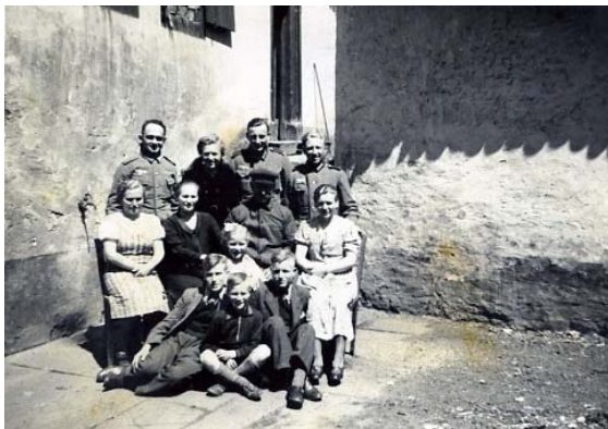
(Familie Niemes im Mai 1940)

Auf dem Besuch der achtjährigen Volksschule in Ebertsheim folgte die Ausbildung zum Papiermacher in der Papierfabrik Eduard Mann in Ebertsheim.