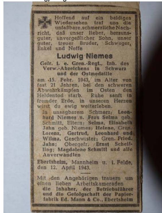
(Todesanzeige vom 12. April 1943)

Erst am 27. März 1943 wurde die Familie über den sinnlosen Tod des gerade einmal einundzwanzigjährigen informiert.