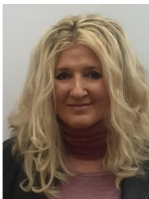
Martina Gärtner PR