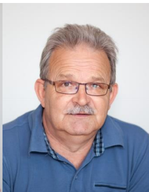
Helmut Reis PR