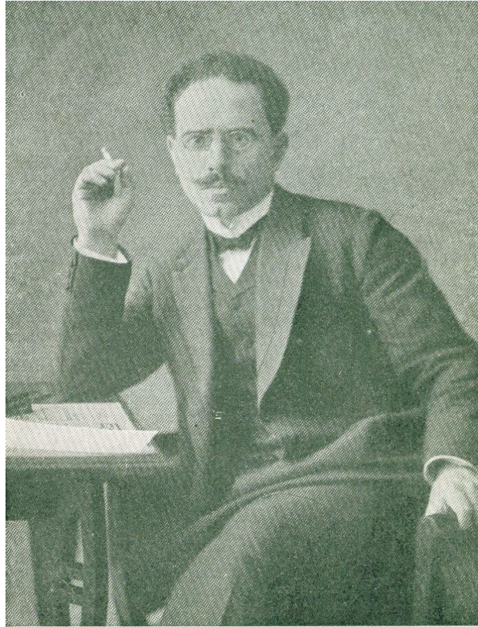
Niederländische Postkarte von Karl Liebkecht (~ 1912)

Karl Liebkecht (1871 - 1919), den NaturFreundInnen eigentlich nur noch als Begründer der KPD bekannt, hat als Mitglied der SPD im Preußischen Abgeordnetenhaus am 11. Dezember 1912 eine Rede gehalten, die unter dem Titel „Die Natur schützen und dem Volke näherbringen“ in der Reihe „Karl Liebkecht Gesammelte Reden und Schriften“ in Band V vom Dietz-Verlag in Berlin (1961) veröffentlicht wurde. Kommentierte Auszüge aus